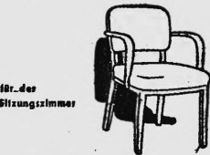
für den Sitzungszimmer