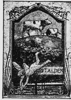
MESSAGER des ALPES - ALPENBOTE

zeuge, Fahrzeuge, Erzeugnisse der Spinnerei und Weberei, Reklameartikel, Maschinen und Maschinenbestandteile, Drucksachen, bildliche Darstellungen.