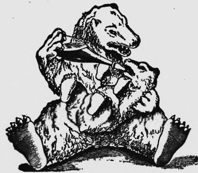
„Bärenmarke“ — Marke „à l'Ours“ — „Bear Brand“ Marca „Oso“ — Marca „Urso“ — Marca „Orso“

Lait (stérilisé, épaissi, condensé, concentré et desséché), crème, crème stérilisée, beurre, farine lactée, poudre de lait, lait pour enfants, farine pour enfants, sucre de lait, médicaments, chocolats, cacao, chocolat au lait (solide ou liquide), beurre de cacao, pâtisserie, produits de la confiserie, conserves de soupes, lait (naturel, stérilisé, épaissi, condensé, concentré et desséché), en combinaison avec du cacao, du thé, du café ou des épices, aliments et boissons en général, photographies, objets en papier, en verre, en porcelaine, en terre et en fer blanc, récipients de tout genre, livres, meubles, phonographes, pièces à musique, instruments de musique, montres, jouets, fournitures de bureau, ustensiles de cuisine, appareils de sport, vêtements, outils, véhicules, articles de réclame, machines et parties de machines, imprimés, reproductions artistiques.