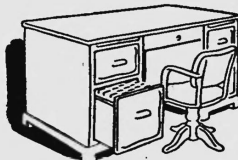
Gediegener Nußbaum-Schreibtisch 6008 mit Polster-Drehfauteuil 895