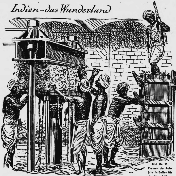
Bild Nr. 13: Pressen der Roh- jute in Ballen für die Verschiffung

Jute, früher auch „Kalkutfehant“ genannt, wird in Indien in riesigen Pflanzungen angebaut und nach der ganzen Welt verschickt.