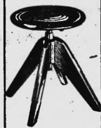
Mod. 1: Fr. 49.—