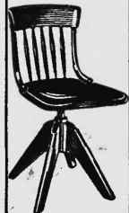
Mod. 2: Fr. 76.— beste Qualität