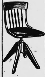
Mod. 2: Fr. 76.— beste Qualität