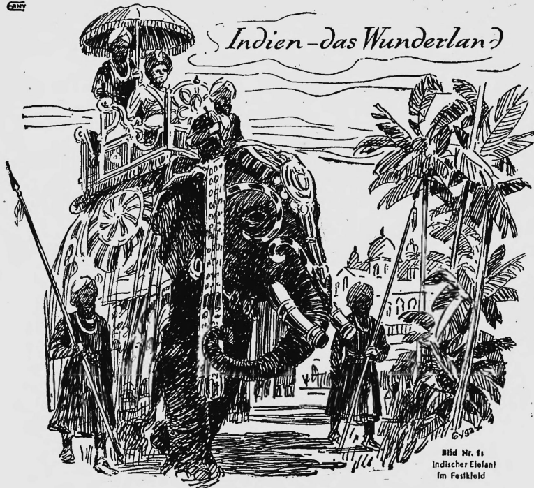
Indien - das Wunderland