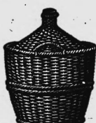
5 bis 60 l