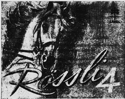
Farbenanspruch: Schimmel auf orangem Grund, Schrift orange und gelb, Ziffer weiss.

Nr. 128880. Hinterlegungsdatum: 3. Mai 1949, 19 Uhr. Burger Söhne, Burg (Aargau, Schweiz). — Fabrik- und Handelsmarke. Tabakwaren, insbesondere Stumpfen.