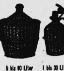
6 bis 40 Liter 1 bis 30 Liter

Kerfisches-, Karbwarer- und Bademittelfabrik Kirchberg (Bern) mit Filiale in Brugg (Aargau) Wieder in allen Grössen u. Quantitäten erhältlich Reparatur defekter Kerfischeben Montz. Preisliste zu Diensten