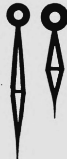
No. 2108 No. 1910