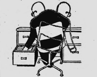
Albert Stoll, Stuhlfabrik, Koblenz (Aargau)

Sie auf diesem praktischen Bürostuhl. Keine Spur von Ermüdung. Bewegungsfreiheit nach allen Seiten. Dieses Stoll-Federdraht-Modell ist in allen Büromöbelgeschäften von Fr. 116.— an erhältlich, andere Modelle ab Fr. 76.—.