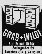
GRAB+WILD Zürich und Udorf Seilergraben 59 Telephon (051) 24 35 88

Schreibtische für Büro und Privat in jeder Preislage erstklassig und preiswert