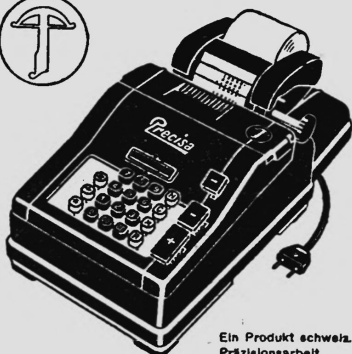
Ein Produkt schweiz. Präzisionsarbeit