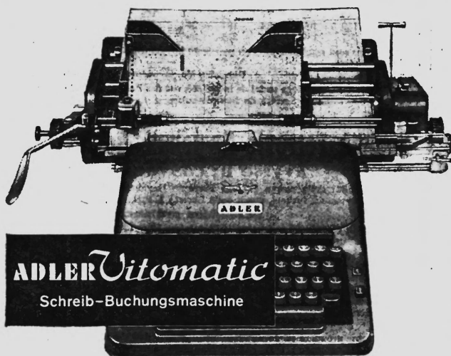
ADLER Vitomatic Schreib-Buchungsmaschine

Mit verbundenen Augen können Sie die Kontenkarte schreibfertig, zeilengerade und auf die richtige Buchungszeile einstellen. Kein Richten — ein Hebelzug genügt!