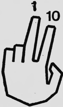
Zwei-Finger-Methode SYSTEM TRACHTENBERG

Abzeichen, Broschüren, Bücher, Drucksachen, Tabellen, Rechenmittel, Rechengeräte, Rechenmaschinen, Kontrollmittel, Kontrollgeräte und Kontrollmaschinen für alle Rechenoperationen.