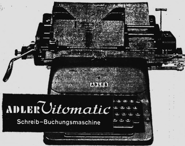
ADLER Vitomatic Schreib-Buchungsmaschine

Mit verbundenen Augen können Sie die Kontenkarte schreibfertig, zeilen gerade und auf die richtige Buchungszeile einstellen. Kein Richten — ein Hebelzug genügt!