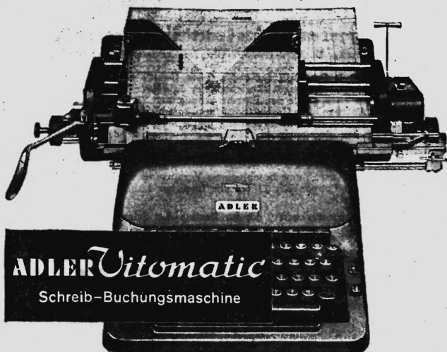
ADLER Vitomatic Schreib-Buchungsmaschine

Mit verbundenen Augen können Sie die Kontenkarte schreibfertig, zeilengerade und auf die richtige Buchungszeile einstellen. Kein Richten — ein Hebelzug genügt!