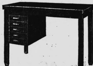
TABLE DACTYLO depuis 218.-