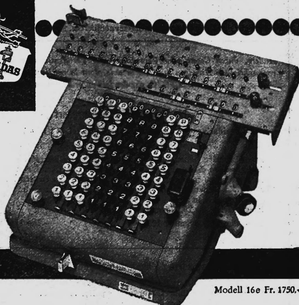
Modell 16e Fr. 1750.-