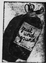
Poly-Felba-Kreuzbodenbeutel mit Kordelzug