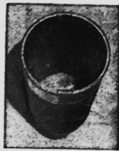
Faß mit Poly-Felba-Rundbodensack ausgekleidet