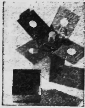
Poly-Felba-Flasche im Karton