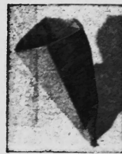
Papiersack mit Poly-Felba-Sack ausgekleidet