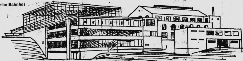
ESH No. 738