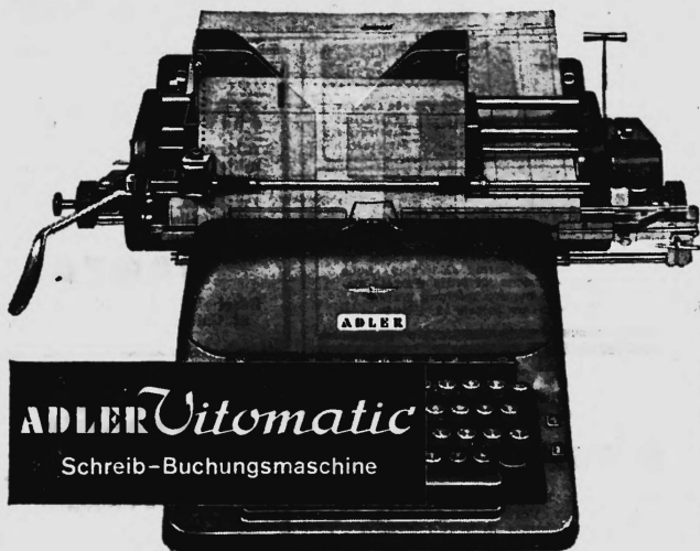
ADLER Vitomatic Schreib-Buchungsmaschine

Für höhere Ansprüche baut ADLER die rechnenden Schreib-Buchungsmaschinen in drei Modellen. Verlangen Sie bitte die unverbindliche Zusendung von Prospekten oder den Besuch unseres Beraters. Service in der ganzen Schweiz.