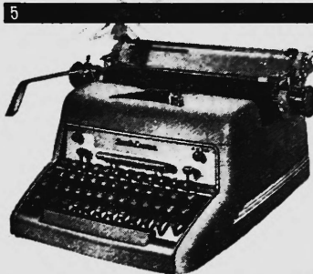
Modelle ab Fr. 1095.-