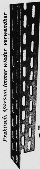
Praktisch, sparsam, immer wieder verwendbar

SAFIM-Winkel sind hergestellt aus Spezialstahl von hoher Festigkeit