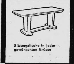
Sitzungsische in jeder gewünschten Grösse

Das Formpult unterscheidet sich von den früher gebräuchlichen Pulten und Schreibtischen durch vollständig neue Linienführung, verbunden mit zeitloser Eleganz und grösster Zweckmässigkeit. Es ist nach einem Spezialverfahren - Hochfrequenzverleimung und Formpressung - hergestellt und hat so ein um 25% geringeres