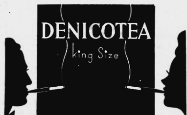
La marque est exécutée en blanc, noir et brun/rouge.

Fume-cigarettes de santé, fume-cigares de santé, pipes de santé, cartouches remplies de cristaux à insérer dans le corps des engins précités.