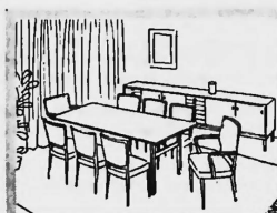
Liefermöglichkeit: In Eiche, Nussbaum oder Teak, mit einem oder zwei Schubladenkorpusen nach Wahl. Bitte besuchen Sie ganz unverbind- lich unsere grosse, interessante Ausstellung.