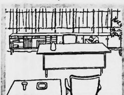
pos das Aufbewahren der Akten Ihrer Sekretärin überlassen. Nur jene Dokumente befinden sich bei Ihnen, die wirklich Ihrer Aufmerksamkeit be- dürfen — diese aber übersichtlich, griffbereit!