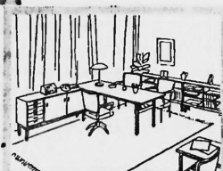
benheiten des Raumes angepasst werden kann. Das neue Pult ist jenen Chefs zugedacht, die sich nicht mit Kleinigkeiten belasten wollen — die im Interesse eines schnelleren Arbeitstem-