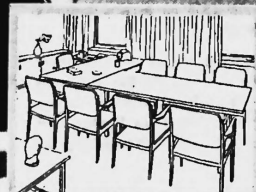
Diese Bilder zeigen Ihnen, wie gut sich das neue Pult mit der dazu passenden Aktenkredenz, den Telefon- und Bucherschranken kombinieren lässt und wie die ganze Einrichtung den Gege-