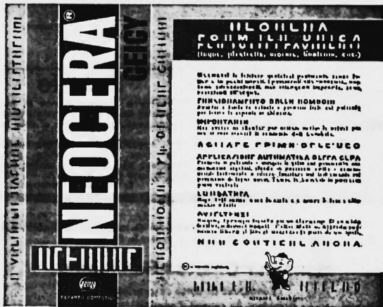
Die Marke wird rot, gelb, schwarz, weiss und beige ausgeführt.

Wachshaltige chemisch-technische Produkte.