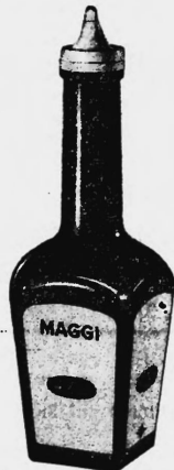
La marque est exécutée en jaune, rouge et brun.

Arômes, condiments, épices, sauces, préparations de soupes, viandes et extraits de viande, conserves de viande ou à base de viande, poissons, conserves de poisson, œufs, pâtes alimentaires, graisses et huiles alimentaires; farines diététiques, légumes et fruits, conserves de légumes et de fruits.