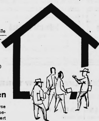
Atelier Paul Weber