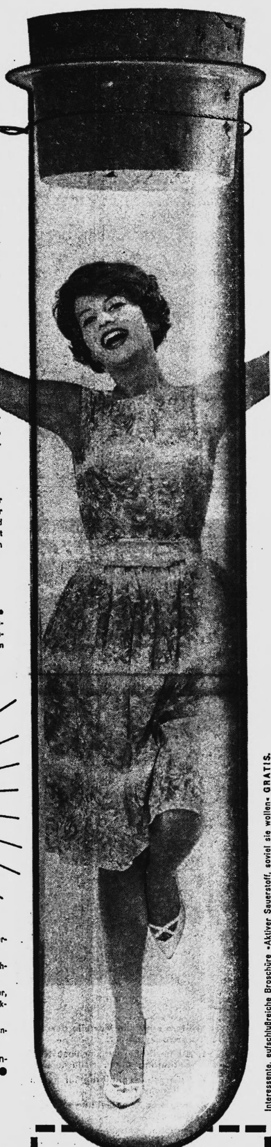
Interessante, aufschlußreiche Broschüre »Aktiver Sauerstoff, soviel sie wollen« GRATIS.

IKS Nr. 22228 Export: Intertred AG, Zürich 22 Copyright A. S. G. 21/60