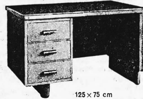
125 x 75 cm