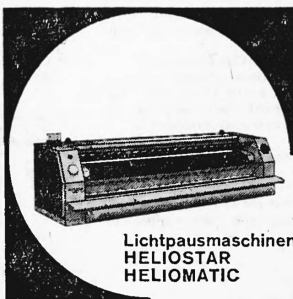
Lichtpausmaschinen HELIOSTAR HELIOMATIC

Kombiniert für Belichtung und Halbflecht- oder Trockenentwicklung für Weiss- und Transparentpausen auf Papieren von 32-210 g. schnell — sauber — wirtschaftlich