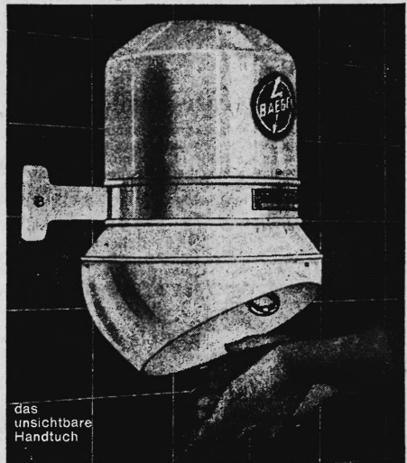
das unsichtbare Handtuch

Mit dem Baege-Händetrockner nie mehr schmutzige und zerrissene Handtücher.