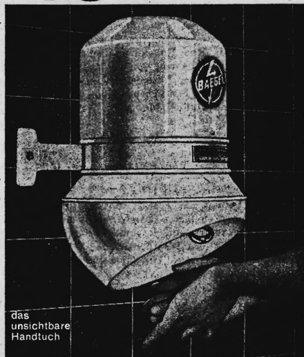
das unsichtbare Handtuch

Mit dem Baege-Handetrockner nie mehr schmutzige und zerrissene Handtücher.