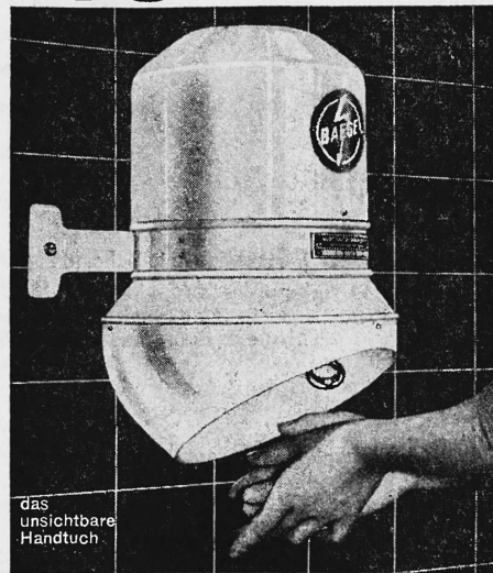
das unsichtbare Handtuch

Mit dem Baege-Handtrockner nie mehr schmutzige und zerrissene Handtücher.