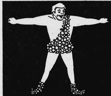
Mister GÉNIE, der weisse Riese!

Wasch-, Putz-, Reinigungs- und Scheuermittel, einschliesslich schäumender Reinigungsmittel, Waschseifen, Seifenflocken, Seifenperlen, Seifenkörner und flüssiger Seifen; kosmetische und andere Toilettenpräparate, einschliesslich Toilettenseifen, Parfüms, Toilettenwasser, Talk- und Deckpuder, Gesichts- und Handpflegemittel, wie Handcremen, Gesichtspuder, Rouge, Lippenstifte (auch in Cremeform) und Gesichtslotionen, Haarpflegepräparate, wie Haartonika, Haarpomade, Brillantine und Shampoo-Präparate, Nagellacke, Nagellackverdünner und -entferner, Adstringentien, Geruchverhinderungs- und -entfernungsmittel (auch solcher für den Haushalt), Riechsalze, Schutzmittel gegen Sonnenbrand, Reinigungswatte, Zahnputzmittel (auch in flüssiger Form), wie Zahncreme und Zahnpulver, Rasiercremen (auch in Aerosolform), Rasierseifen; Insektentilgungsmittel; Manikürgeräte, Zahnbürsten, Rasiermesser, Rasierklingen, Rasierapparate. (Int. Kl. 3, 5, 8, 21)