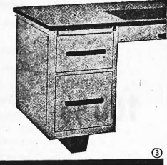
Pultsockel Typ 54 M

Verlangen Sie Prospekte und Bezugsquellennachweise