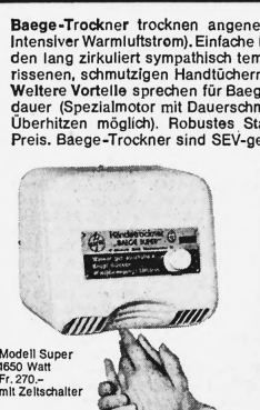
Modell Super 1650 Watt Fr. 270.— mit Zeitschalter