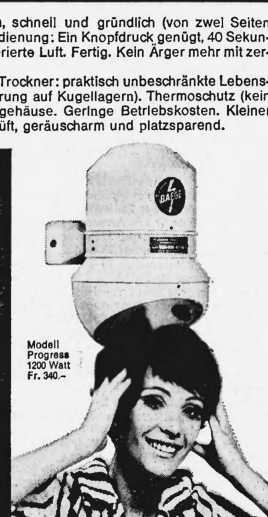
Modell Progress 1200 Watt Fr. 340.—

Baege-Händetrockner gehören in jeden fortschrittlichen Betrieb: Cafés, Restaurants, Hotels, Büros, Fabriken, Spitäler, Sanatorien, Warenhäuser, Kinos, Theater, Tankstellen usw.