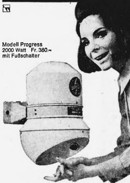
Modell Progress 2000 Watt Fr. 380.— mit Fußschalter