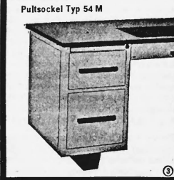
Pultsokkel Typ 54 M

Stahlmöbelfabrik F. Gut AG Hägendorf Tel. (062) 46 11 49