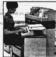
Prix d'ordre Fr. 72200.- à Fr. 500000.-

Ordinateur de classe internationale désormais à la portée des petites et moyennes entreprises comme des grandes. Computer de moyenne informatique de 4 à 16 K et dans la conception des grands ensembles, 3 e génération, «mots variables». Avec ou sans unité à comptes magnétiques, 400 signes alphanumériques par face de compte (800 par fiche). Imprimante rapide alphanumérique de technique novatrice 50-60 signes-seconde. Programme avec minicassette à bande magnétique. Système pleinement intégré grâce à ses appareils périphériques.