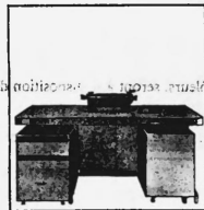
Prix d'ordre de Fr. 20500.- à Fr. 45000.-

3 modèles de base de machines à facturer et à décompter, de 3 à 32 et à 256 mémoires et de 4 à 16 K, entièrement électroniques. Entrée et sortie sur bandes et cartes.