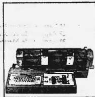
Prix d'ordre de Fr. 6100.- à Fr. 98000.-

Automates comptables selon différents systèmes électromécaniques et électroniques de 2 à 256 mémoires ou compteurs avec texte complet et/ou texte abrégé. Introduction frontale simple, double, avec cellule photo-électrique et comptes magnétiques. Connexion cartes et bandes perforées.