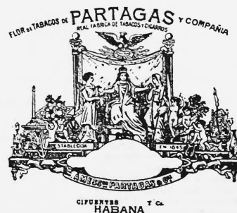
Die Marke wird golden, rot, grün, gelb, hellblau, schwarz, weiss, dunkelgrün, rosa, violett und hellbraun ausgeführt.