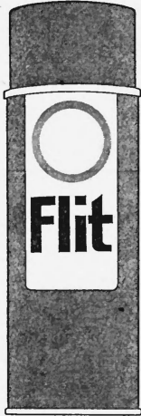
Die Marke wird grün, braun, weiss und schwarz ausgeführt.

Insektizide, Geruchverhinderungsmittel und Desinfektionsmittel. (Int. Kl. 5)