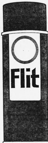
Die Marke wird rot, blau, weiss und schwarz ausgeführt.

Insektizide, Geruchverhinderungsmittel und Desinfektionsmittel. (Int. Kl. 5)