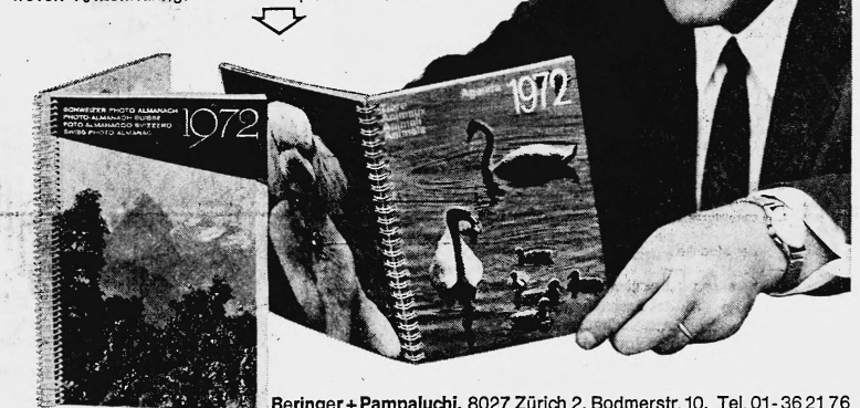
Beringer + Pampaluchi, 8027 Zürich 2, Bodmerstr. 10, Tel. 01-36 21 76

Schweizer Photo-Almanach, Neu Agenda , 15x21 cm, 15x21 cm, mit 62 Aufnahmen, mit 30 entzückenden Farbfotos von Tieren.