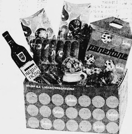
enthält Tessiner Spezialitäten

Fr. 35.— inbegriffen die elegante Weihnachtspackung und Versand in die ganze Schweiz.