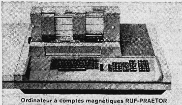
Ordinateur à comptes magnétiques RUF-PRAETOR

En réalité, on ne peut comprimer les frais que si la direction dispose d'informations suffisantes pour lui permettre de prendre des décisions appropriées. Pour cela, il faut avoir à portée de main des chiffres constamment à jour, tels que peut les livrer à tout moment notre ordinateur à comptes magnétiques RUF-PRAETOR. Grâce à RUF-PRAETOR vous pouvez établir vos factures plus rapidement, surveiller de façon optimum la gestion de vos stocks, tenir un contrôle rigoureux de vos débiteurs, dresser des statistiques, en les établissant d'après des critères différents. De nombreuses maisons qui étaient jusqu'ici réticentes à l'égard de tous ce qui s'appelle ordinateur se sont désor-