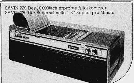
SAVIN 220 Der 10000fach erprobte Alleskopierer SAVIN 230 Der Superschnelle - 27 Kopien pro Minute