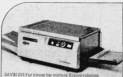
SAVIN 215 Für kleine bis mittlere Kopiermengen

Einer unserer SAVIN-Kopierapparate entspricht auch Ihren Anforderungen.