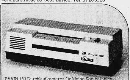
SAVIN 150 Durchlaufkopierer für kleine Kopiermengen