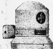
Modell Progress 1200 Watt Fr. 400.-