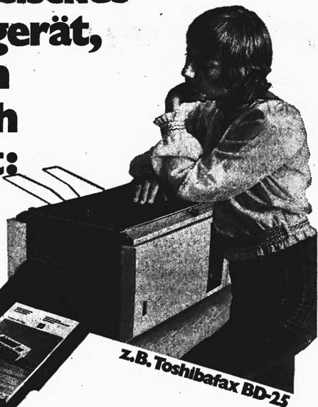
Z.B. Toshibafax BD-25

Original einlegen, Knopf drücken, in Sekunden ist die Kopie da, haarscharf, exakt, genau wie das Original