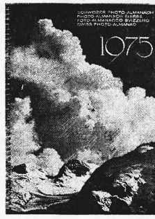
Tisch-Agenda mit 62 Aufnahmen, wovon 3/4 mehrfarbig.

Rüegg-Naegeli 8022 Zürich, Beethovenstrasse 49 Telefon 01/270250 7000 Chur, Quaderstrasse 17 Telefon 081/225283 6003 Luzern, Pilatusstrasse 2 Telefon 041/223538 8152 Glattbrugg, Kanalstrasse 19 Telefon 01/8104141