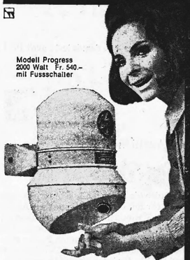
Modell Progress 2000 Watt Fr. 540.- mit Fusschalter